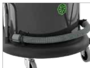
TUYAU DE VIDANGE