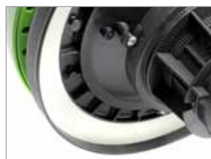
JOINT DE TÊTE NOVATEUR